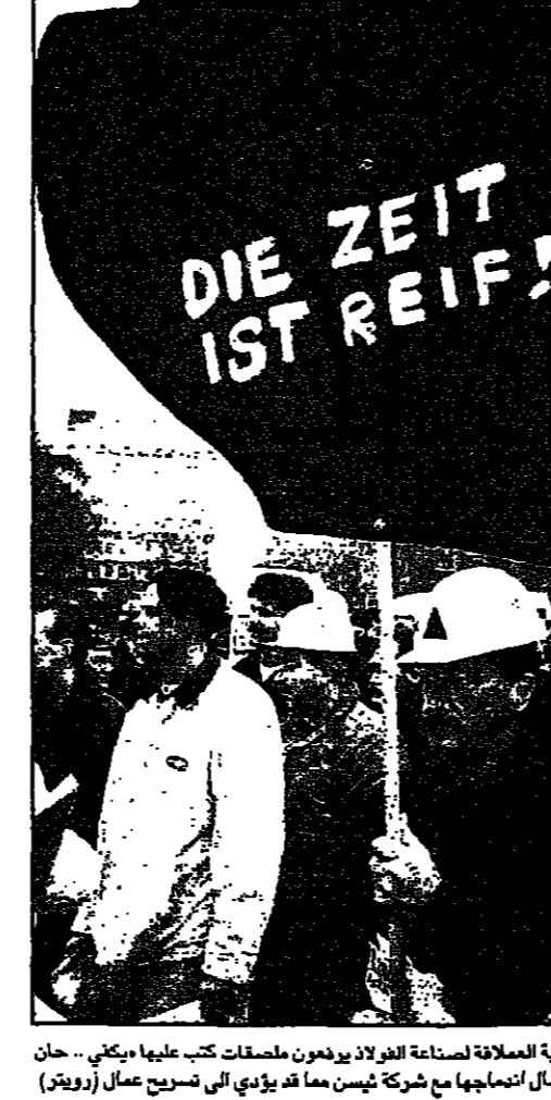
متظاهرون من عمال شركة مورخ كروب الألمانية لصناعة الفولاذ يدعون لمصالحات كتب عليها يمكن... حان وقت العمل، خلال احتجاج لهم امس على احتمال انسحابها من شركة ثيسن مما قد يؤدي الى تسريح عمال

واشنطن - رويترز: أعلنت وزارة التجارة الامريكى امس الخميس ان العجز التجاري ارتفع بنسبة 21,1 في المئة الى 12,71 مليار دولار في كانون الثاني (ديسمبر) الماضي مسجلا أعلى مستوياته منذ نحو عشر سنوات.